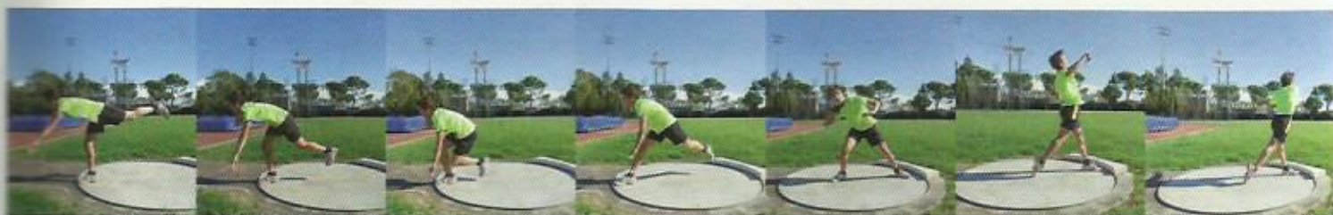
La progressione di lancio nella tecnica dorsale.

L'atleta parte rivolgendo le spalle alla pedana, in appoggio sullo stesso piede del braccio di lancio, ed effettua una traslocazione spingendo energicamente indietro la gamba di appoggio, distende l'altra gamba verso la direzione di lancio, la appoggia al suolo e inizia un movimento di torsione che parte dall'anca, arriva al busto che si raddrizza, e termina poi la rotazione verso la direzione di lancio. Il braccio si distende e il peso viene lanciato. Per evitare di uscire dalla pedana, l'atleta effettua un "cambio", cioè inverte con un salto gli appoggi.