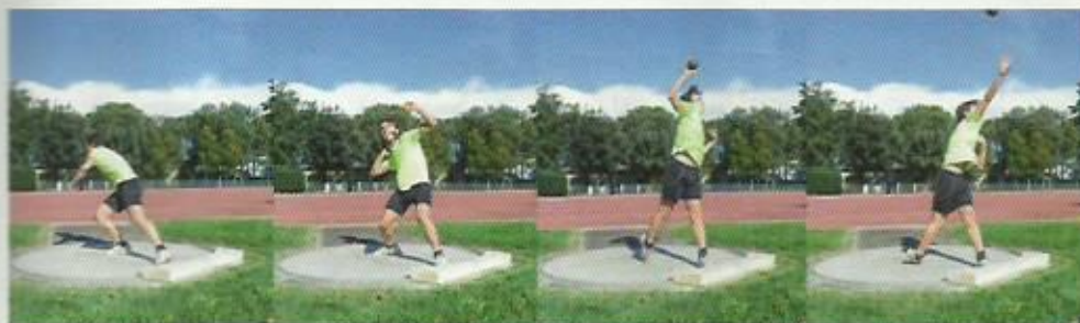
La progressione di lancio nella tecnica laterale.